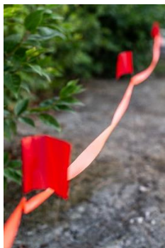
No cruzar esta banda