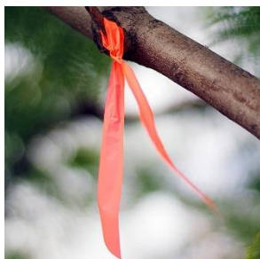
Seguir estas marcas

La ruta está debidamente marcada, además del apoyo de banderilleros/as en el camino.